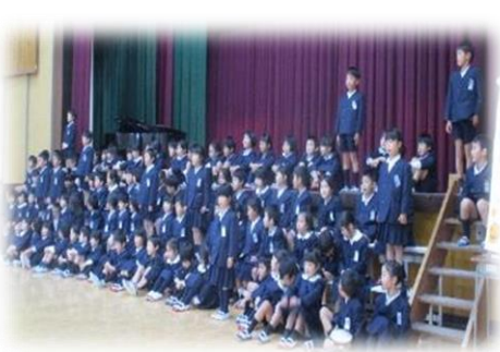
1年 リズムよくうつたえよう

11月18日 学習発表会を行いました。各学年の日頃の学習の成果を紹介することができました。今年は、演出についてもいろいろと検討をしました、いかがでしたか？