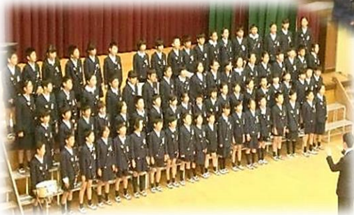
4年 届けよう 笑顔のおくりもの