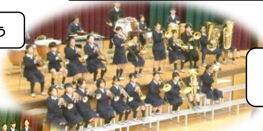
音楽クラブ アフリカンシンフォニー