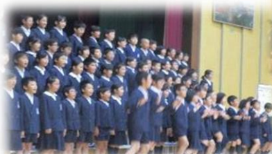
5年 響け！心ひとつに