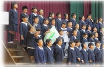
2年 大すき生きもの