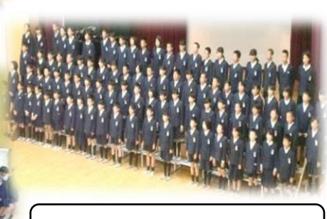
6年 ふるさと海田未来へつなぐ