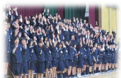
3年 まつりだわっしょい！ ～海田のまつり～