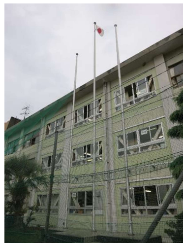
海田東小学校の織田ポール