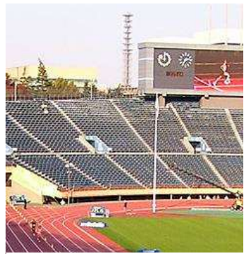
旧国立競技場内の織田ポール

日本人初の金メダルをとったアムステルダム五輪の三段跳びの記録15・21mの高さがある。